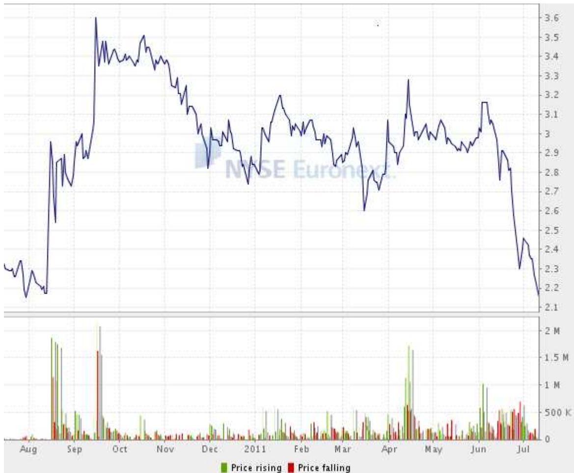
Graphique sur 1 an

Les différents codes pour suivre le cours de GECI International sont :